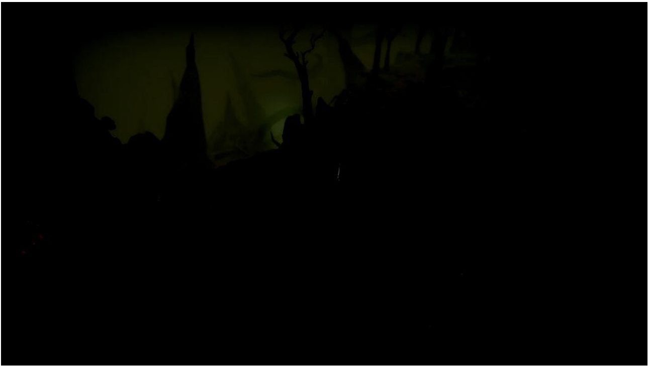
Petit aperçu de la forêt maudite