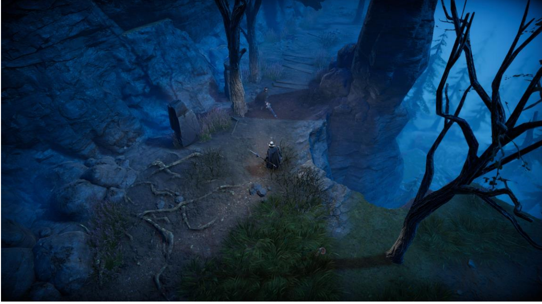
V Rising'in yukarıdan aşağıya kamerası.