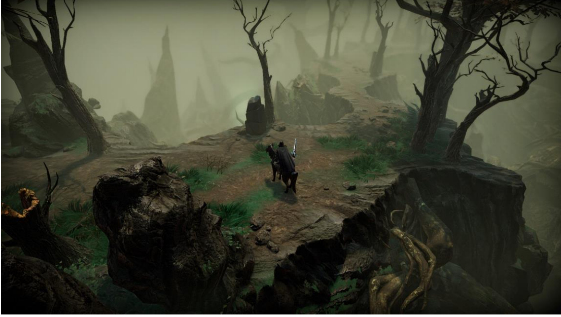
Lanetli ormandan bir kesit.